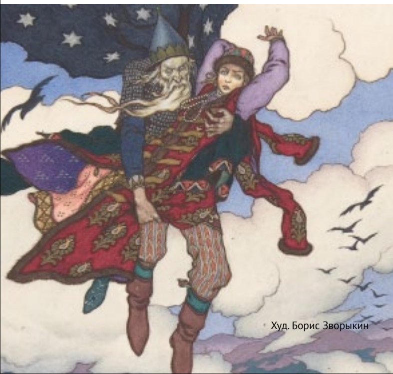
Худ. Борис Зворыкин

Иллюстрации сделанные русским художником Борисом Зворыкиным (1872–1942 гг.) проникнуты любовью к России: ее истории, культуре, старине. Традиция зримого выражения красоты Божьего мира, красоты добра пришла к нам из глубины веков – от иллюстраторов старинных рукописей, в творчестве которых черпал вдохновение Борис Зворыкин. Наследниками этой традиции являются и создатели лучших отечественных мультфильмов.